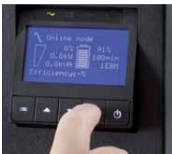
Displej 9SX lze naklonit o 45° pro snadnou čitelnost