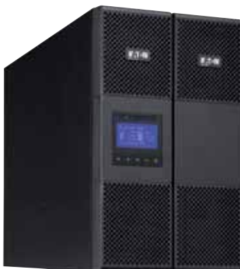
9SX 11 kVA